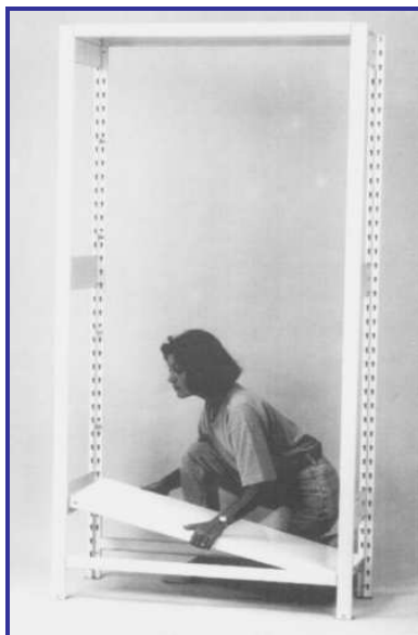
Az acélpolcokat alul és felül a hossztartókra helyezze!