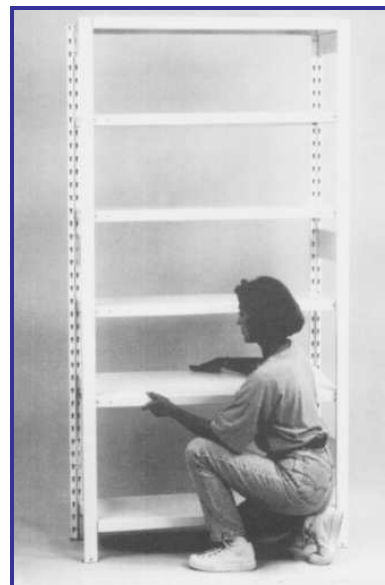
A köztes polcokat 4 polctartó kapocsra vagy hossztartóra helyezze

2000mm állványmagasságig 2 pár, 2000-3000 mm között 3 pár hossztartót kell beszerezni. Az alsó hossztartó párt a padlózattól legfeljebb 400 mm-re, a felső hossztartó párt az állványlétra tetejétől legfeljebb 500 mm-en belül lehet elhelyezni. A közbenső hossztartó pár a polcosztásnak megfelelően körülbelül középre kerül.